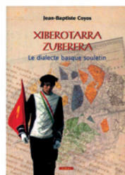
Xiberotarra - Zuberera. Le dialecte basque souletin

AUTORA: PORRES MARIJUÁN, ROSARIO BILBAO: UPV-EHU, 2007 393 P. : IL. ; 24 CM. ISBN: 978-84-8373-914-3