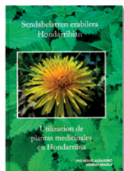
Sendabelarren erabilera Hondarribian. Utilización de plantas medicinales en Hondarribia

EGILEAK: PÉREZ ALDASORO, PÍO; IRAOLA, JOSEMA HONDARRIBIA: UDALA, 2008 III OR. : IR. ; 22 CM.