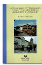
Activaciones patrimoniales e iniciativas museísticas: ¿por quién? y ¿para quién?