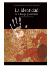
La identidad de la Europa posmoderna