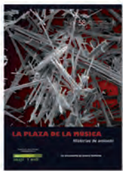
Musika Plaza / La Plaza de la Música

GIDOILARIA ETA ZUZENDARIA: JUAN MIGUEL GUTIÉRREZ GENEROA: DOKUMENTALA IRAUPENA: 70' EKOIZPEN DATA: 2010