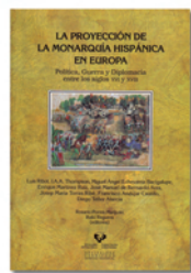
La proyección de la Monarquía Hispánica en Europa