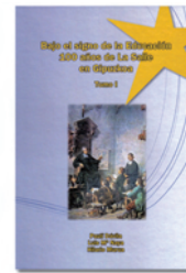
Bajo el signo de la Educación. 100 años de La Salle en Gipuzkoa